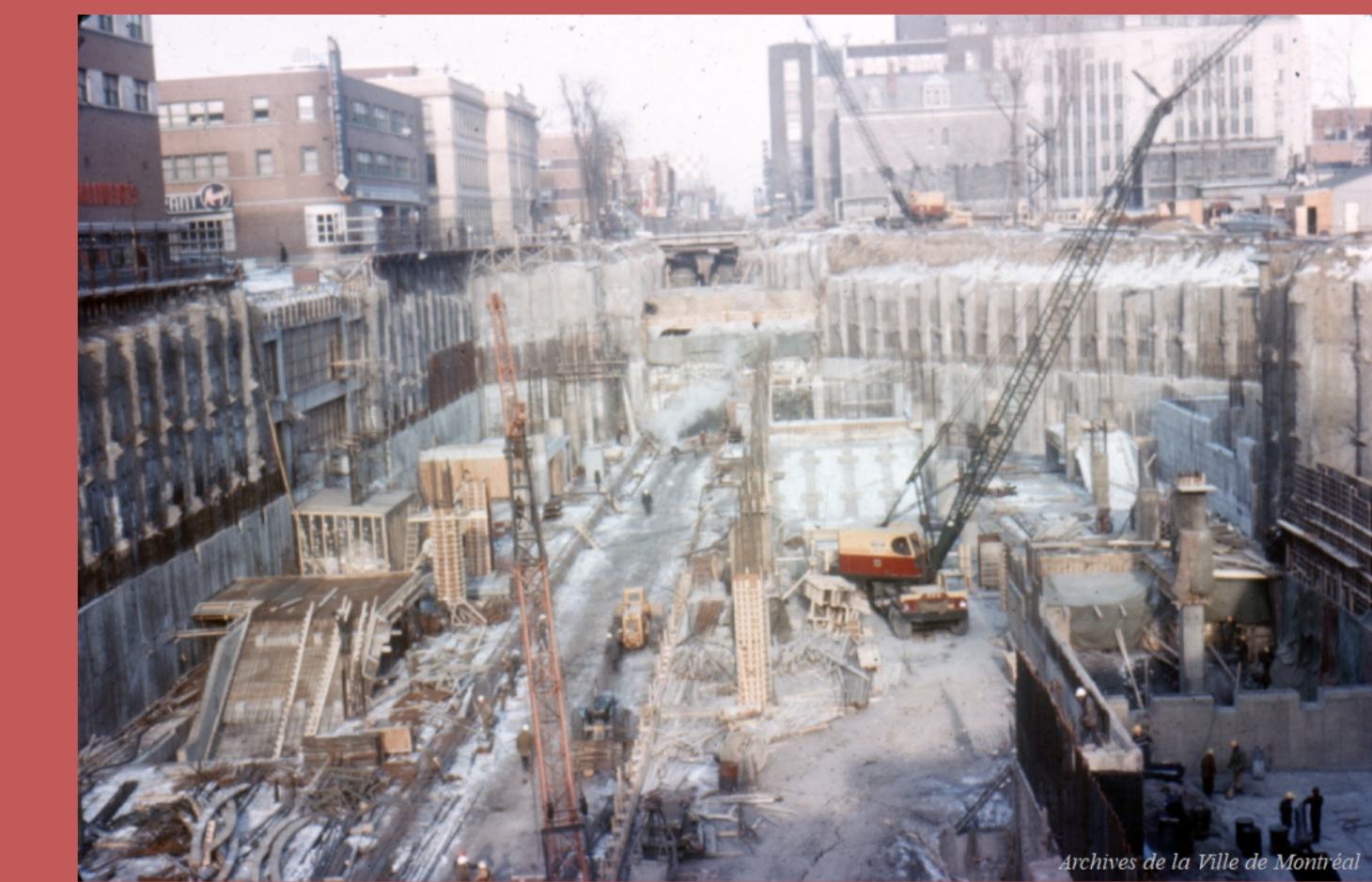
Construction de la station de métro, 1964, Archives de Montréal, VM097-Y-02, D005A-007-01

Un projet de transformer le stationnement en place publique, le Square Berri, est envisagé à la fin des années 1980. Ce projet suscite toutefois l'inquiétude des commerçants du quartier, comme DeSerres et Archambault. En effet, un article de La Presse datant du 19 décembre 1989 est titré « Le futur Square Berri, un refuge de clochards et de drogués? Les commerçants s'inquiètent ».