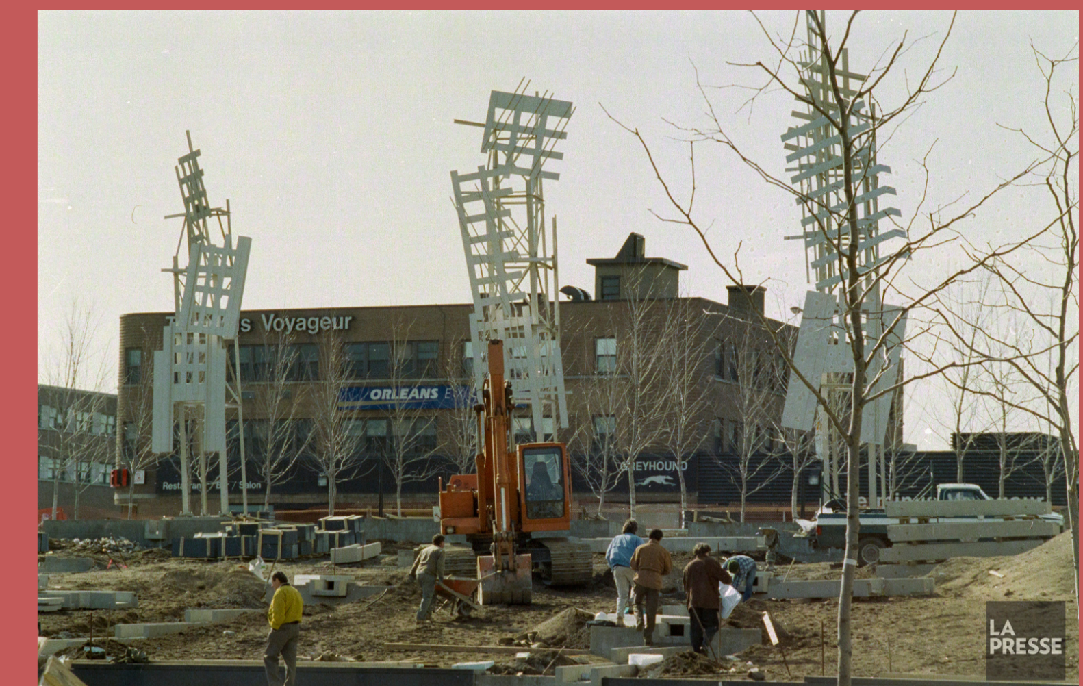
Construction de la Place Émilie-Gamelin, 1992

La Place Émilie-Gamelin reste un espace d'une grande mixité sociale qui joue toujours un rôle important dans l'offre de services aux populations marginalisées. On a d'ailleurs pu observer ce rôle pendant la pandémie, lorsque la place est devenue le lieu de multiples services offerts aux personnes en situation d'itinérance.