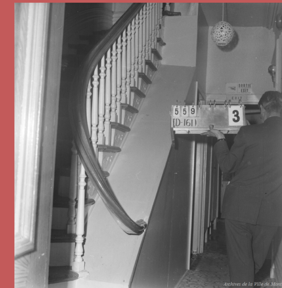
Coin Sainte-Catherine et Berri, 1963, M. Hamelin, Archives de Montréal, VM094-C0395-001

La Ville en profite pour entamer les travaux de démolition qui lui permettront ensuite de construire la station de métro Berri-de-Montigny (Berri-UQAM).