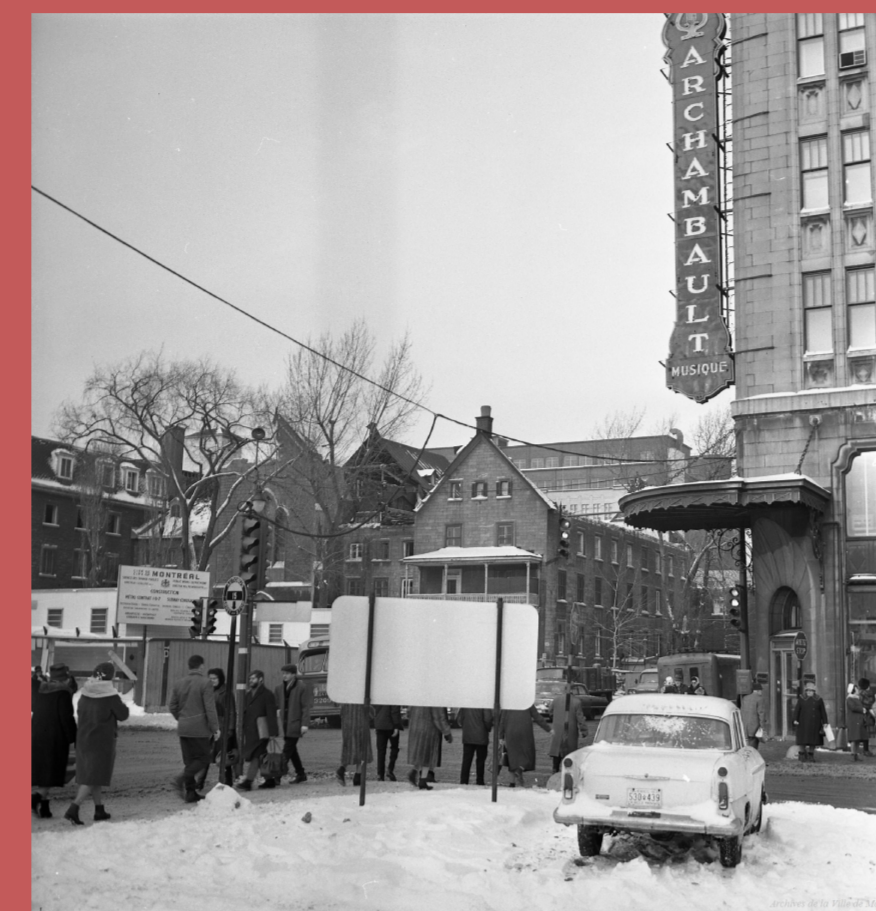
Coin Sainte-Catherine et Berri, 1963, Archives de Montréal, VM094-C291-08

L'Asile de la Providence pour les femmes vulnérables est alors créé. Trois ans plus tard, d'autres services sont offerts aux indigents de la paroisse tels que le dépôt des pauvres et l'Oeuvre de la soupe qui fonctionneront jusqu'à la destruction des bâtiments en 1963.