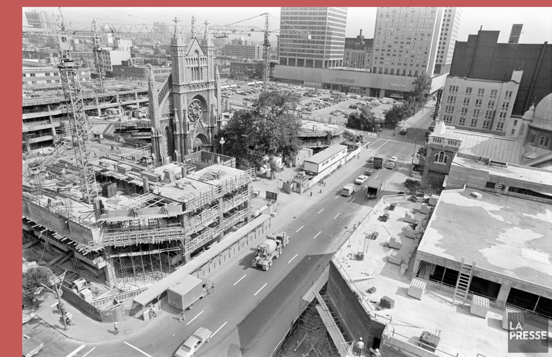
Construction de l'UQAM et le stationnement, 1977